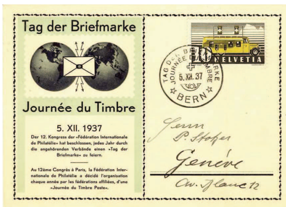
Carte postale officielle de la Journée du timbre 1937 (oblitération « BERN, TAG DER BRIEFMARKE, JOURNÉE DU TIMBRE, 5.XII.37 »)

La Journée du timbre est la fête et le grand rendez-vous des philatélistes. Mais en fait, depuis quand fête-t-on cet événement? Lors d'un Congrès tenu en 1936 à Luxembourg, la Fédération internationale de philatélie (FIP) décide que les Fédérations membres organisent une « Journée du timbre ». Elle sera célébrée le dimanche suivant le 7 janvier, date anniversaire de la naissance d'Heinrich von Stephan, fondateur de l'Union Postale Universelle (UPU). Mais, dès 1937, des difficultés ont empêché plusieurs pays de célébrer cette Journée à la date prévue. Réunie à Paris, la FIP décide alors de renoncer à l'idée d'une date fixe et laisse à chaque pays la liberté de choisir la période la plus opportune.