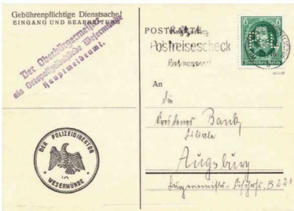
Très rare lettre de Wesermünde (Allemagne) de 1936, avec un timbre perforé «POL».

La perforation des timbres a été un phénomène postal mondial recensé dans 150 pays ou administrations postales. On estime à près de 50'000 les perforations types. Le plus prolifique pays de timbres perforés est la Grande-Bretagne avec 18'000, suivi de l'Allemagne avec 12'000.