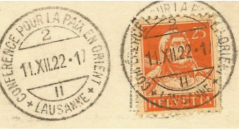
Cachet postal de la Conférence, mais portant le numéro «2» dans la partie supérieure.

Pendant toute la durée de la Conférence, un bureau de poste spécial fonctionna à Ouchy. Il prenait en charge le courrier des délégués et des nombreux journalistes. Ce bureau oblitéra aussi le gros volume de courriers déposés par les privés venus à Ouchy ou envoyés pour oblitération et acheminement. Le cachet postal mentionnait «LAUSANNE + CONFÉRENCE POUR LA PAIX EN ORIENT + II» et la date. Deux types existent, l'un avec le chiffre «1» en haut, l'autre avec le chiffre «2» (voir illustrations). Une flamme de «LAUSANNE 1 / EXP. LETTR.» fut également utilisée.