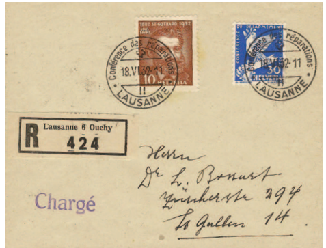
Lettre expédiée en «Recommandé» (étiquette «R» de «Lausanne 6 Ouchy») et oblitérée avec le cachet postal «LAUSANNE, Conférence des réparations» en date du 18.VI.32.

Comme pour la Conférence de 1922, le courrier de privés et de collectionneurs est assez courant. Par contre, les plis des délégations ou des délégués, envoyés dans leurs pays respectifs, sont très recherchés.