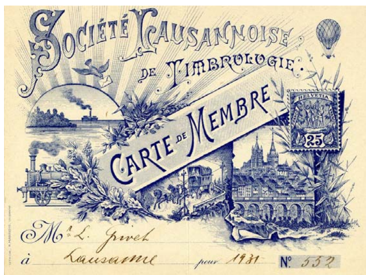
Carte de membre SLT d'autrefois