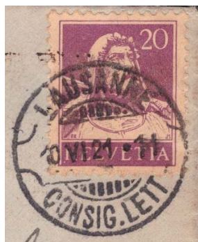
Cachet lame de rasoir, peu courant de LAUSANNE CONSIG. LETT. du 10 juin 1921