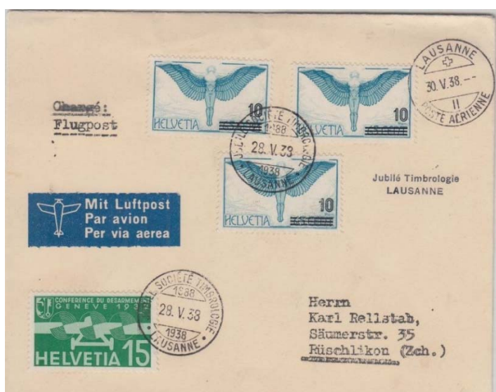
Lettre aviation avec cachets postaux de Lausanne 28 mai 1938 du Jubilé 50 ème anniversaire de la SLT et Lausanne poste aérienne 30.V.38