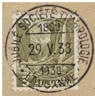
Idem cachet Jubilé OS 180 50 ème sur timbre 201 Z